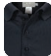
noir / black