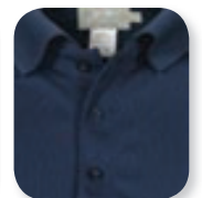
marine foncé / dark navy