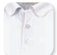
blanc / white