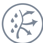
CONTRÔLE DE L'HUMIDITÉ