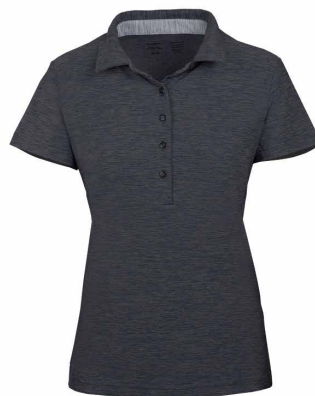
Noir chiné / Gris pâle chiné