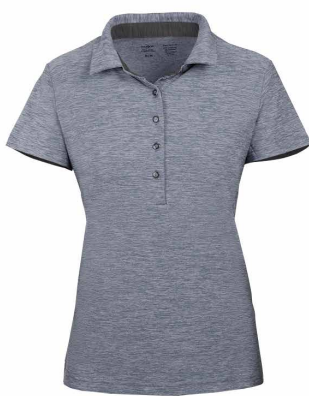
Gris pâle chiné / Noir chiné