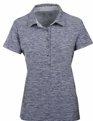
Marine chiné / Gris pâle chiné