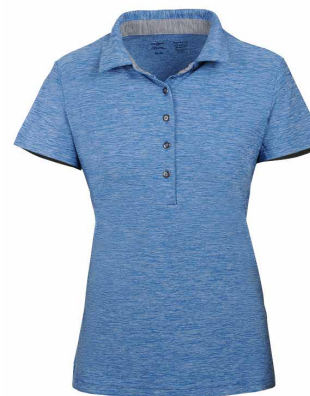
Bleu chiné / Gris pâle chiné